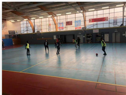
Créneau de futsal