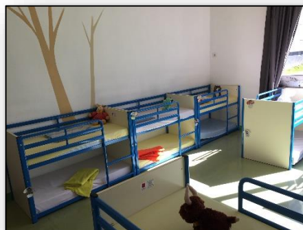
Salle de sieste à la Rotonde

Le quartier de Lambézellec est en forte évolution depuis de nombreuses années. Nous souhaitons nous rapprocher au plus près des besoins et attentes des familles du quartier. En réaménageant les espaces de la Rotonde, notamment la salle de sieste (qui utilise deux espaces), en la dotant de « couchettes double repos », nous avons réaffecté un espace d'animation aux enfants. Cette transformation a permis un gain d'une dizaine de places sur le centre de loisirs (mercredis et vacances scolaires). Notre capacité d'accueils passe ainsi de 49 à 60 places tout en préservant la dynamique collective sur un site unique.