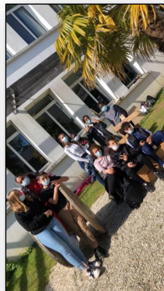
Aménagement du patio

Les jeunes accueillis sont régulièrement impliqués dans les actions développées par l'association. Ils sont porteurs d'idées et participent pleinement à la vie de leur quartier. Leurs contributions et leurs implications ont permis aux habitants de porter un regard différent sur eux.