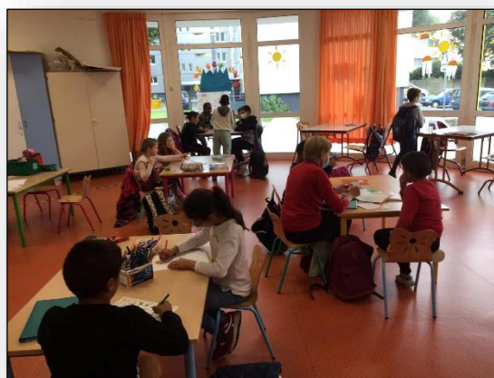
Accompagnement scolaire à la Rotonde

Le contexte sanitaire en ce début d'année 2021 était encore incertain. Nous avons toutefois maintenu notre action auprès des enfants et collégiens de l'accompagnement scolaire, malgré les couvre-feux et le confinement du printemps. Pour éviter au mieux le brassage des publics, les collégiens étaient accueillis au secteur jeunesse de la Maison de Quartier, les mardis et jeudis soir ; les enfants à la Rotonde les lundis, mardis, jeudis et vendredis soir.