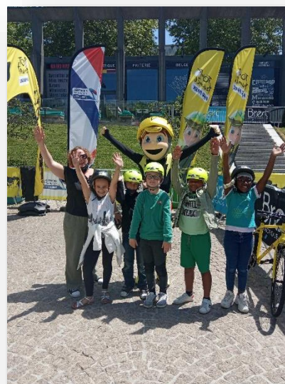
Le Tour de France

Depuis de nombreuses années, nous portons une attention plus particulière en direction des enfants du quartier qui ne fréquentent pas les espaces de loisirs traditionnels : de nombreux enfants sont livrés à eux-mêmes sur le quartier et ne fréquentent pas les structures d'accueil de loisirs. Nous avons amplifié et renforcé cette action en détachant de façon plus régulière une animatrice permanente sur les vacances scolaires. L'animatrice s'appuie sur une dynamique d'animation de rue afin de nouer le contact avec les enfants et leurs familles tout en leur donnant la possibilité de participer à des activités collectives, en se rapprochant des dispositifs existants (ALSH enfants et Espace de Vie sociale). Cette action rencontre son public, en fonction des actions proposées, 6 à 8 enfants participent aux animations et sorties mises en place.