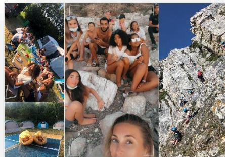
Séjour à Telgruc sur Mer

Cet été, nous avons installé une base sur le camping du Centre Nautique de Telgruc sur Mer. Ce site a accueilli différents groupes d'enfants et de jeunes sur une quinzaine de jours. Les 12/14 ans y ont séjourné durant 5 jours. Une semaine de baignade, de farniente et d'activités nautiques sous un soleil radieux.