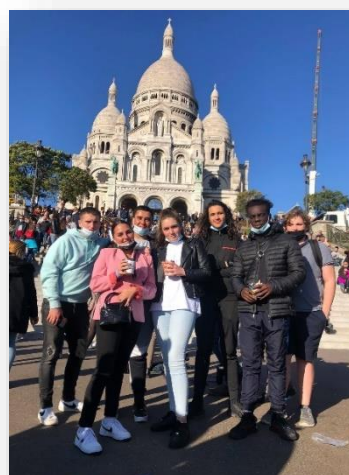
Séjour à Paris

Durant les vacances d'Automne, les 15/17 ans sont partis à la découverte de la Capitale, de ses monuments, de ses musées. Le groupe a participé pleinement à l'organisation et à la mise en place de ce séjour (réservations, programme, autofinancements).